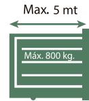
40 Aperturas por Hora