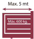
40 Aperturas por Hora